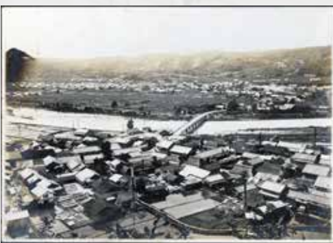
高山城跡辺りからみた土岐津町全景 昭和時代初頭 橋の向こう側（現在のセラトピア付近）にはまだ建物がなかった