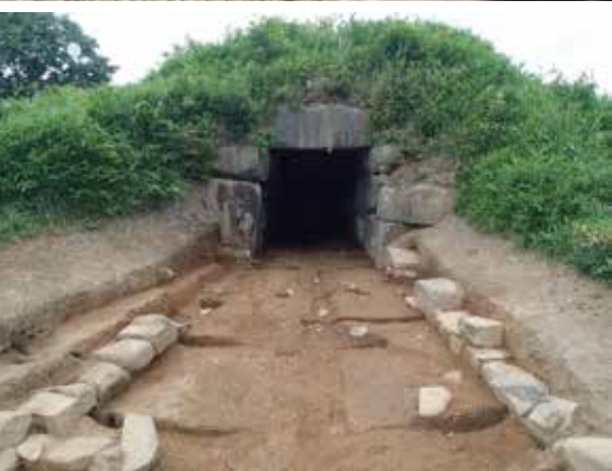
乙塚古墳 上：整備完了後 下：石室発掘調査の様子

【遺跡見学と展示解説】 ※要入館料 窯跡の日 4/30（日）14時～（元屋敷窯見学と重文公開展） 古墳の日 5/14（日）14時～（乙塚・段尻巻古墳見学と乙塚古墳展）