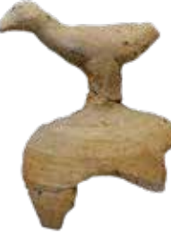
須恵器 鳥紐蓋 乙塚古墳