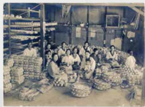
窯焼きの作業風景 現在の泉梅ノ木町・昭和15年頃 焼きあがった煎茶碗を10碗ずつ藁で縛り、10束一括りにした

当館では、土岐市に暮らす人々がどのような生活を送ってきたのかを知る手がかりとして、昔の写真を集めています。地域の日常的な一コマを記録し、伝えていくことも博物館の大事な役割です。「広報とき」などで募集を呼びかけたところ、市民から約 200 枚の写真が集まりました。