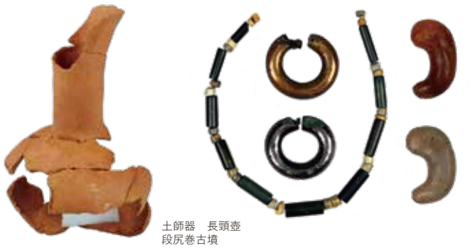
土師器 長頸壺 段尻巻古墳