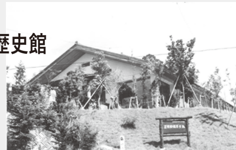
開館当初の美濃陶磁歴史館