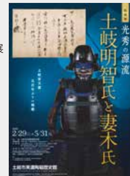
令和2年特別展ポスター