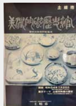
開館告知ポスター