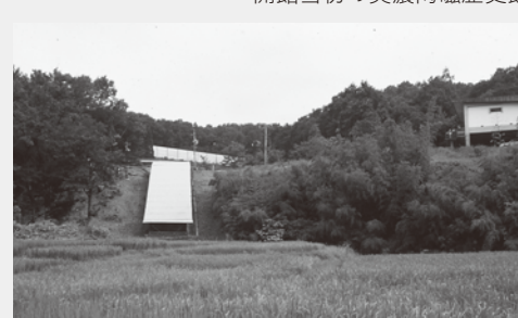
当時の元屋敷窯の様子。館より徒歩5分