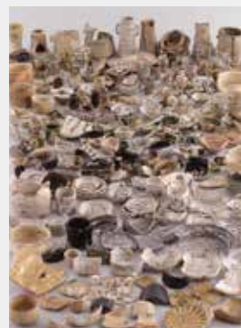
元屋敷窯出土陶片