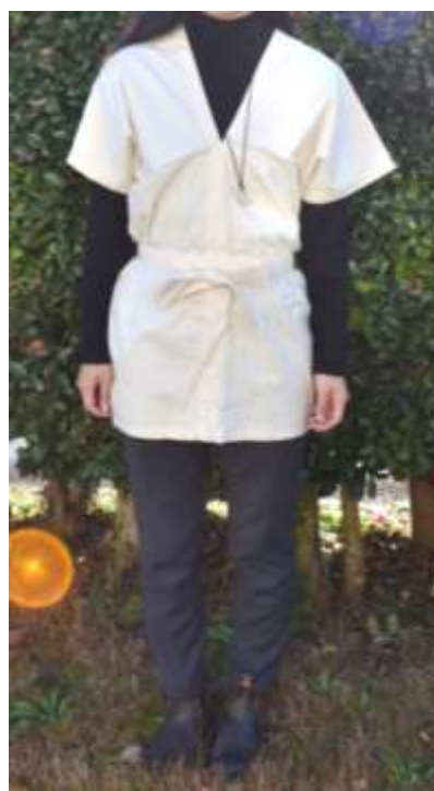
着用例 ※大人でも着られます